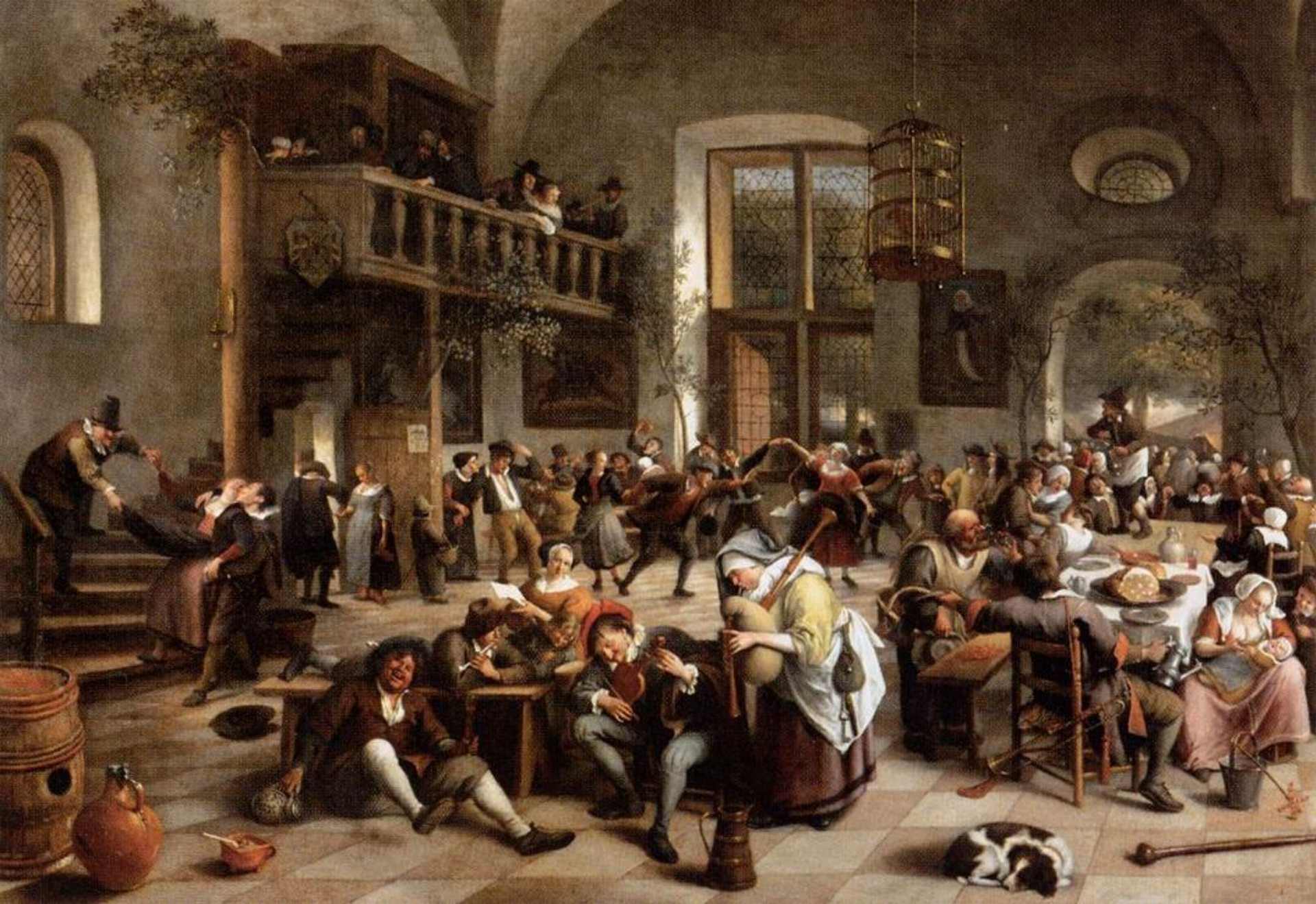
IL DIPINTO Jan Steen, Revelry at an inn , 1674.